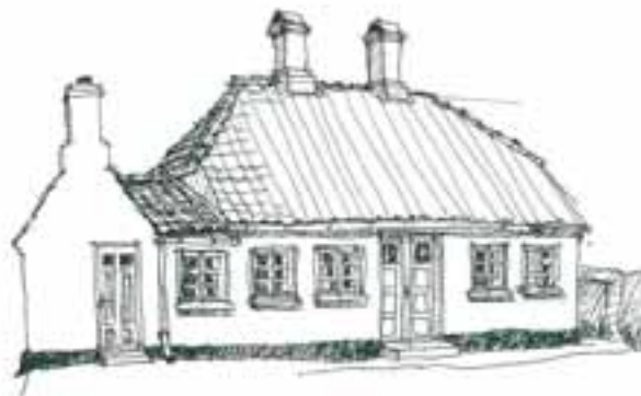
På Stryngade er et andet af de små sømændsindfugt. Her forenes med et højt skovstuegul og det karakteristiske, tværsnitlige søkket.

Livstræspænnen fra Strynø er kun registreret et enkelt sted uden for øen, så spjæsnestruen har været at finde blandt øens smedkere.