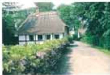
Op ad Kirkevej hænger blågrønne græssede blomsterblaver ud over tagkøllet.

Indtil omkring 1850 blev de fleste huse bygget af Pø' Bager. Hans huse var små øst-vestorienterede bygninger med lave halvvalnede tage. De havde ofte fjernt søkket, pudset og hvidkalket murværk og grønmalte vinduer med to spjæsnede rammer. Malt på en af husets langsider sad en trefløjet indgangsdør med ruder ovenpå, hvori var indfældet den for Strynø karakteristiske Livstræspænn: Sokkelstuen var gæmbrag fra stengårdene mellem gårdefterne.