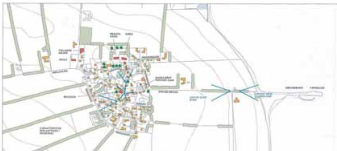
Stryne By, 1:8.000