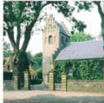
Stryne kirke ligger smukt bag kirkepladsens højstener.

På brovejen opføres et lille le- og pakhus, som i en senere version står på samme sted. Byen fik stempeltrykning omkring 1925, og telefon og el i begyndelsen af 1930'erne. En bil- og julehavn på sydsiden er anlagt i 1920'erne. I 1954 blev der indført et egentlig fergeleje for at lette af- og tilkørslen. Stryne fik egen bilfærge i 1966, da Syd-fynske Dampskibsselskab opførte med besejlingen.