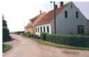
Det Skjærgadestræde i Ringgaden åbnes for udgang over markene og åbner mod Stryne Kule.