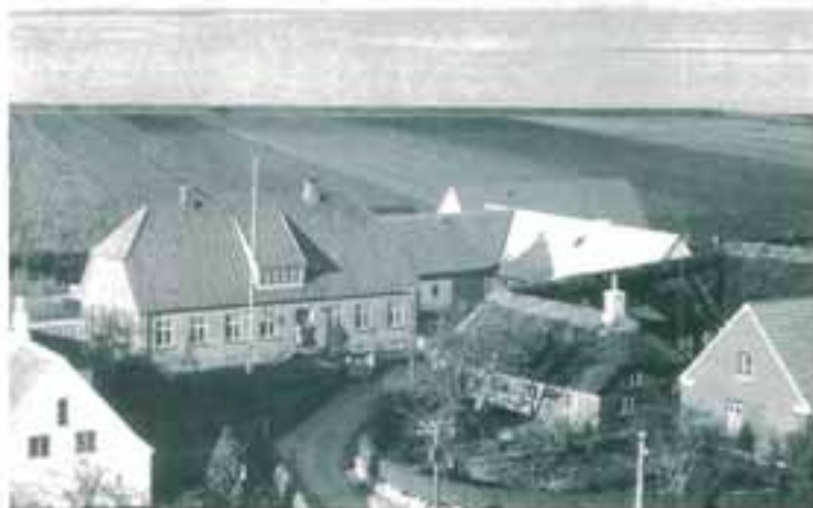
Strynø Kalv bebyggelse, bestående af tre gårde, klæmpet sig sammen på midten af øen. Foto fra ca. 1915