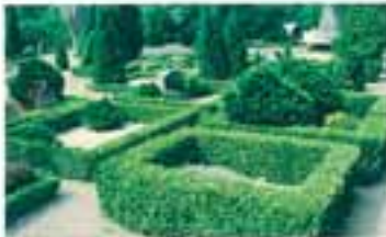
Flora af Strynø Kirkes græstue står særlig fornøjelse på grund af den selvstændige layoutplanlægning på alle sider.

Strynø Kalv har i årtiender solgort et lille mikro-kommun - hvor øens beboere i princippet har kunnet leve hele livet, fra fødsel til død, alene under hinens øens haa.