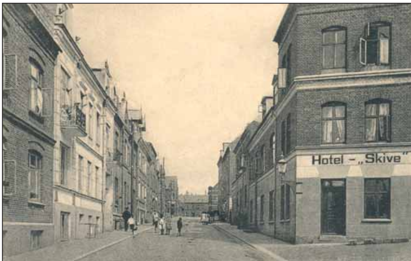
Voldgade i Skive. Historiske fotos er ofte rige på detaljer og informationer om den oprindelige arkitektur.

2000 - Landskabs-konventionen (Firenze) har som formål at sikre en bæredygtig landskabsbeskyttelse gennem beskyttelse, forvaltning og planlægning. Landskabet betragtes som en vigtig komponent i livskvaliteten og for den lokale identitet. Derfor skal landskabspolitikken, der bygger på offentlighedens inddragelse, integrere landskabet i den fysiske planlægning, i kultur- og miljøpolitikken samt i de sektorpolitikker, der i øvrigt har betydning for landskabets udvikling. Offentlighedens forståelse for landskabsværdierne skal styrkes, og der skal opstilles landskabskvalitetsmål og udvikles de nødvendige redskaber til implementeringen af mål og politikker. Konventionen, som er ratificeret den 20. marts 2003, har relationer til Den Europæiske landskabs- og biodiversitetsstrategi.