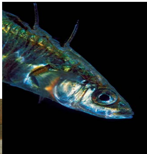
Foto: øverst, hundestejle (Lars Lauersen), Småplettet Rødhøj (Birgit Thorell). Midt: havgræs og alm. strandkrabbe (Orbicon). Nederst: pighvar (Birgit Thorell).